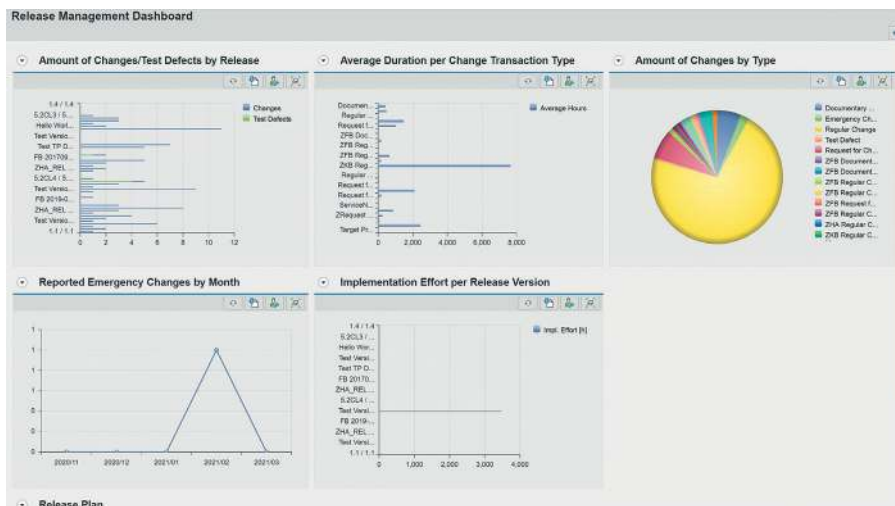
Übersichtlich und intuitiv zeigen die Dashboards der ESM Suite 5 die relevanten Daten zum Release-Management.

Eine Vielzahl der Bestandskunden kann kaum noch nachvollziehen, welche Menge an Guidelines und anderen Anweisungen SAP in den vergangenen Jahren für den Releasewechsel angeboten hat. Dabei liegt die Antwort auf zahlreiche Fragen nahe – und das sogar räumlich gesehen: Soluteive sitzt auf Steinwurfweite zur SAP-Zentrale nahe Walldorf und betätigt sich als Softwaretuner für alle SAP-Lösungen. Das